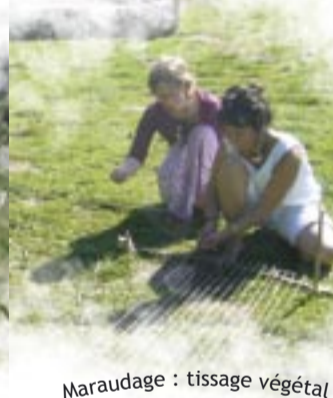
Maradage : tissage végétal