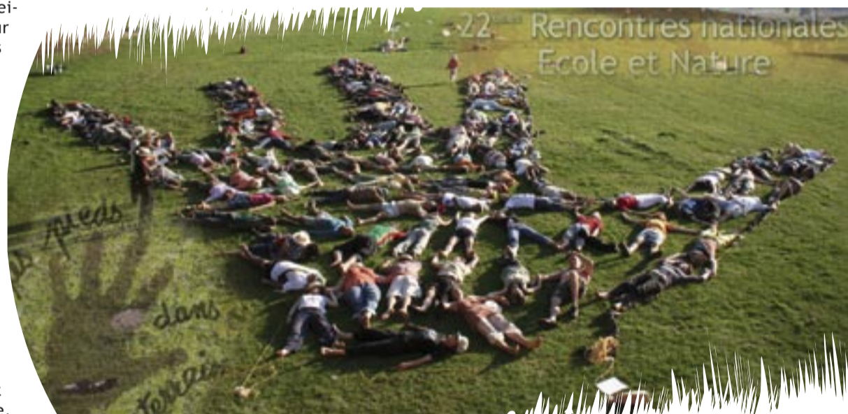
Restitution du Projet Arts et nature

► Une sélection de photographies est visible à l'adresse http://photos.ecole-et-nature.org