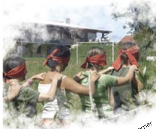
Immersion : les pieds dans le terrier