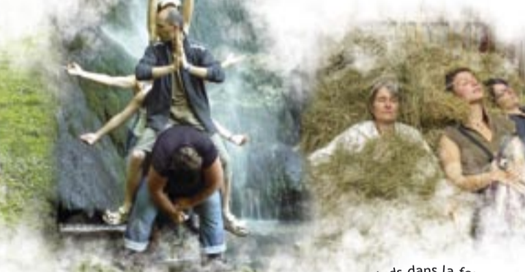
Projet Arts et nature