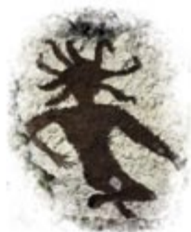
Projet Arts et nature